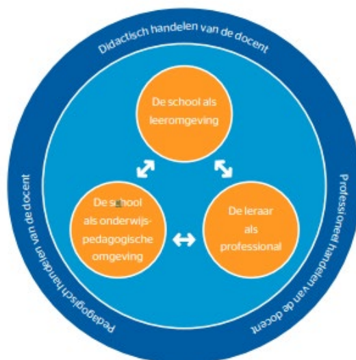
Figuur 1. Bewerking van het model “Een brede professionele kennisbasis en de kern van het beroep”.

Het PDG is gebaseerd op de herijkte Generieke Kennisbasis (Vereniging Hogescholen, 2017) die drie kennisdomeinen onderscheidt: pedagogisch handelen, didactisch handelen en professioneel handelen. Ook de zes beroepstaken van het Kwalificatiedossier docent mbo (MBO Raad, 2015) dienen als bron voor het PDG-traject.